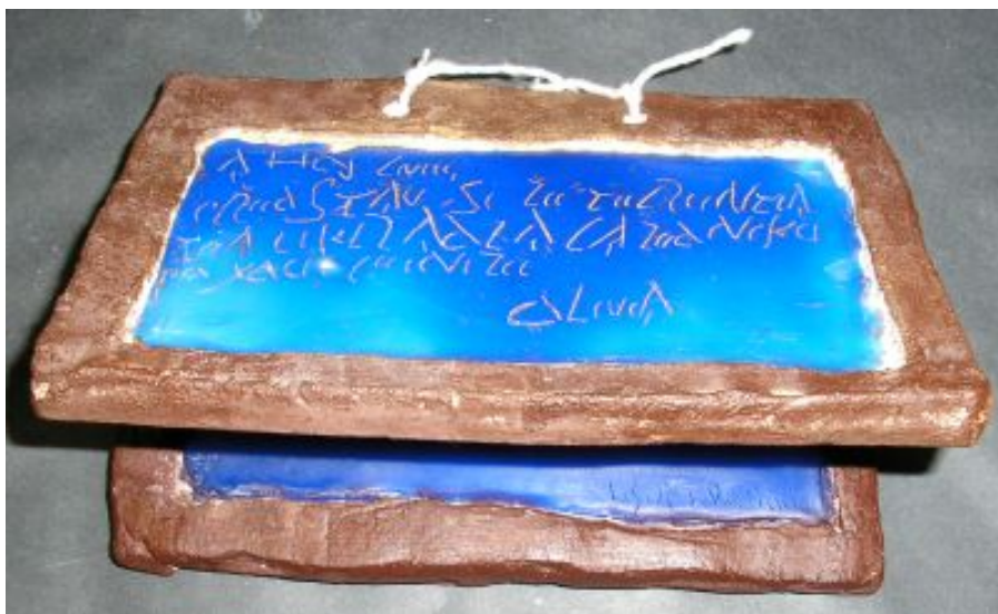
Výsledky keramické tvorby v rámci hodin výtvarné výchovy