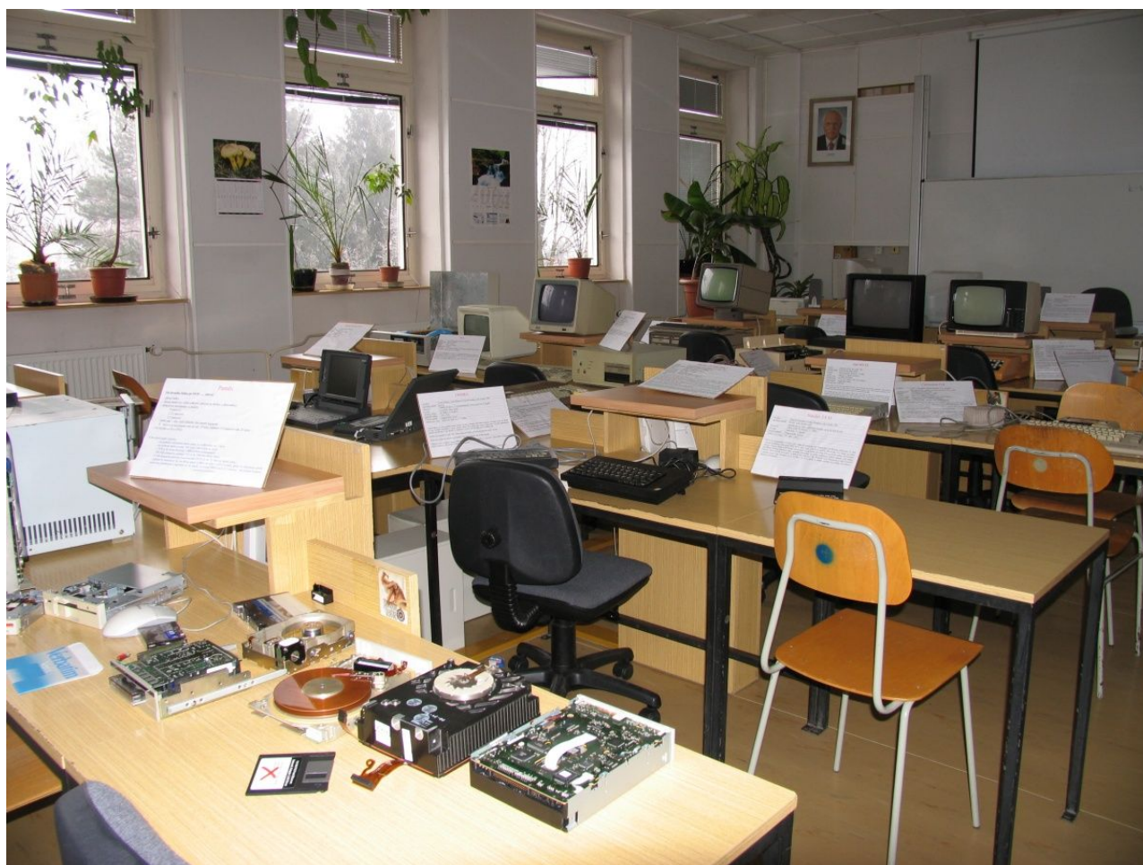
Úspěšná výstava historie počítačů, 7. – 10. 3. 2006