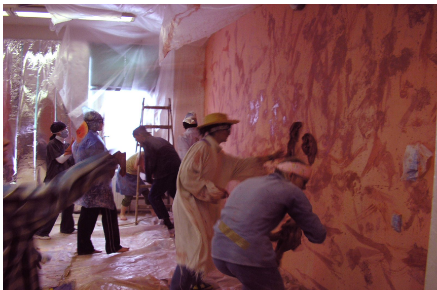
Studenti kreativně tvoří – malování stěny ateliéru výtvarné výchovy