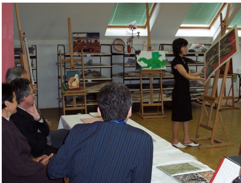
Maturitní zkouška z výtvarné výchovy v ateliéru

Gymnázium V. Makovského, Leandra Čecha 152, 592 31 Nové Město na Moravě