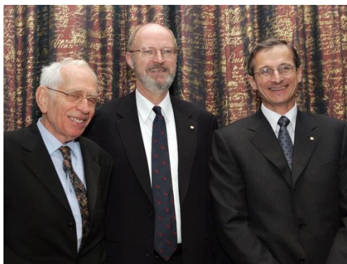
Schrockovi spolupracovníci: Zleva: Yves Chauvin, Robert H. Grubbs a Richard R. Schrock