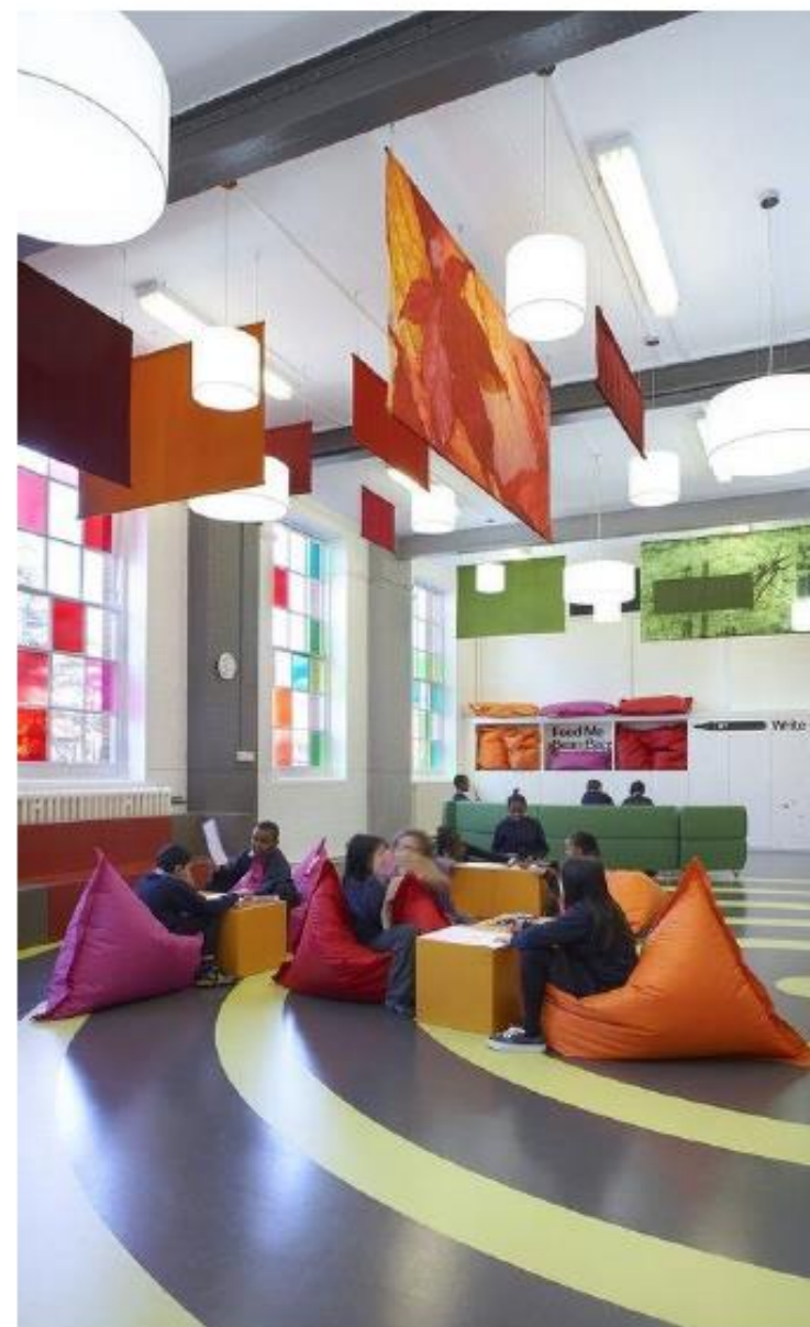
členitost stropu díky zavěšeným pruhům textilu + zlepšení akustiky prostoru