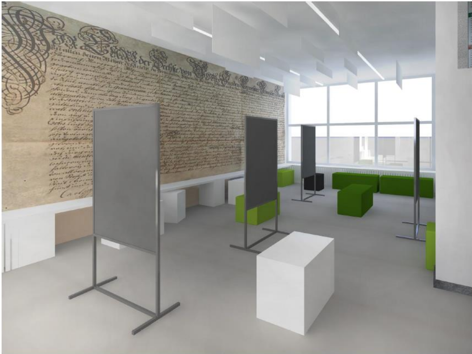
VIZUALIZACE ( uspořádání s využitím boxů a panelů)