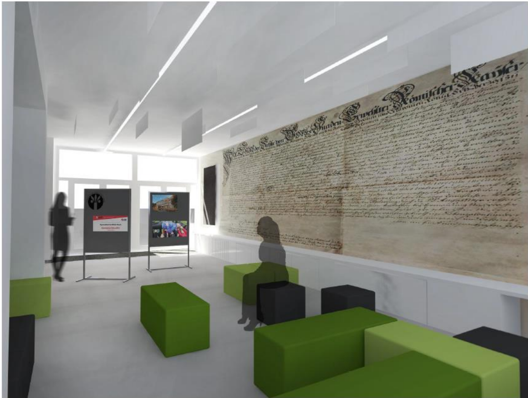
VIZUALIZACE (barevné řešení nábytku možné i v cihlové barvě - dle barev gymnázia)