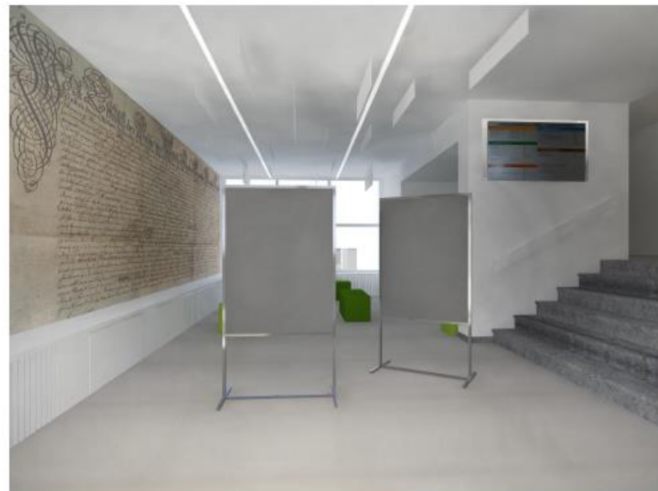
předělení prostoru panely - prezentace školy