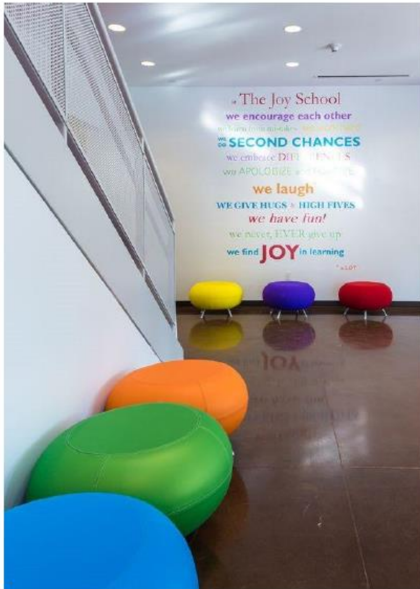
čistý interiér a barevný sedací nábytek