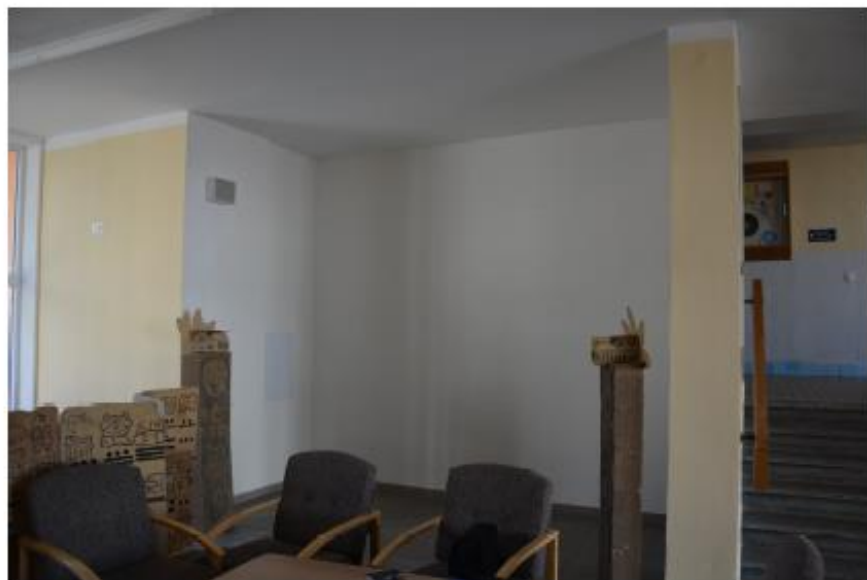
FOTOGRAFIE STÁVAJÍCÍHO STAVU